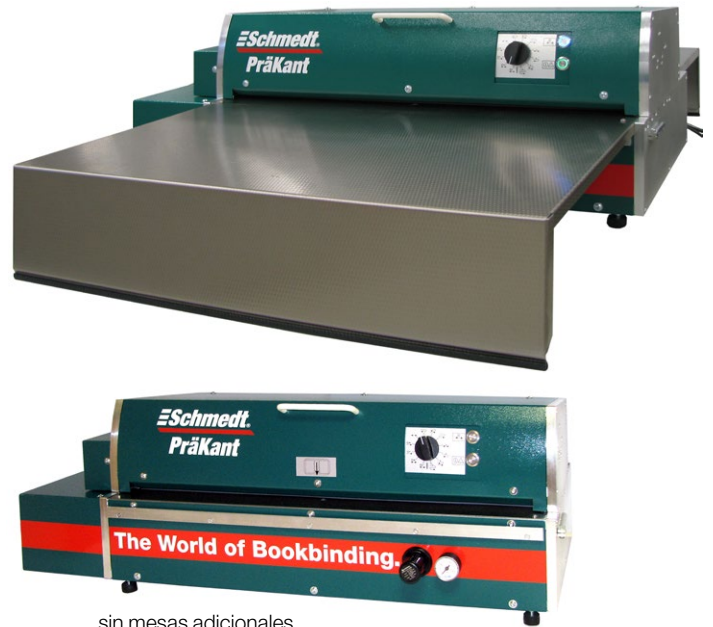
sin mesas adicionales

La PräKant es una máquina de ribetear para doblar y prensar en la elaboración de cubiertas de libros y otros productos. Asimismo es idónea para prensar cubiertas laminadas y con espejo. Se caracteriza por las siguientes especificaciones :